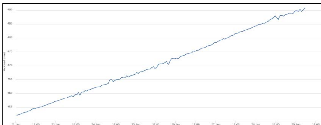
Figur 2 Bevegelsene på ekstensometer 8 i løpet av siste uke. Figur 1 viser hvor dette er plassert på Veslemannen

Kontaktperson Einar Anda, tlf. 920 78 500