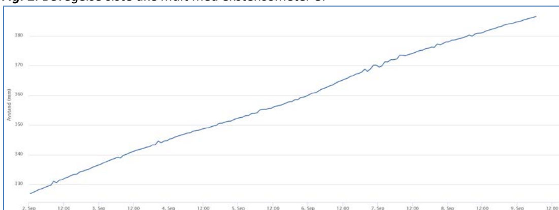
Fig. 2. Bevegelse siste uke målt med ekstensometer 8.