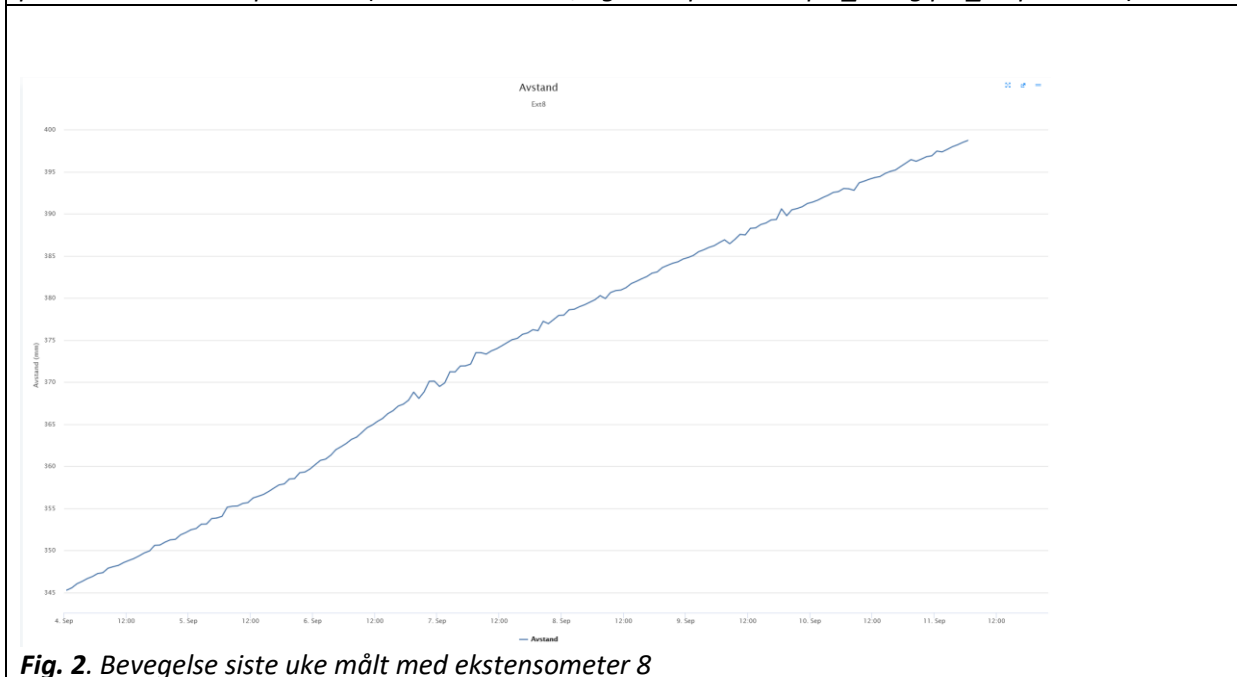
Fig. 2. Bevegelse siste uke målt med ekstensometer 8